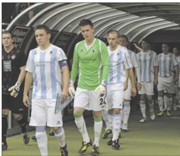
Impressionen vom 1:0 für den TSV 1860 in Kaiserslautern am 8. Juni 2011.