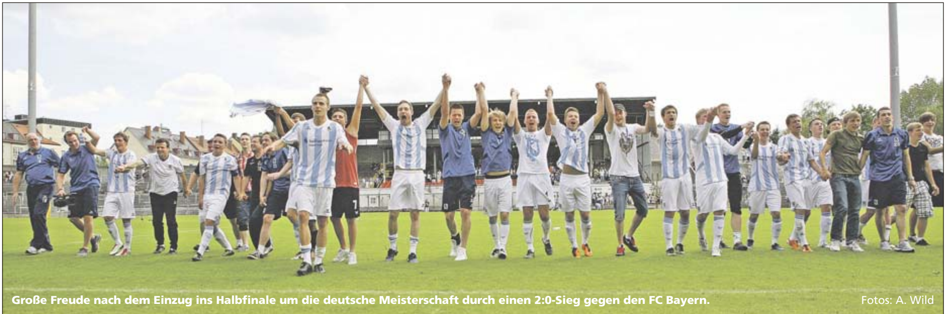
Große Freude nach dem Einzug ins Halbfinale um die deutsche Meisterschaft durch einen 2:0-Sieg gegen den FC Bayern.